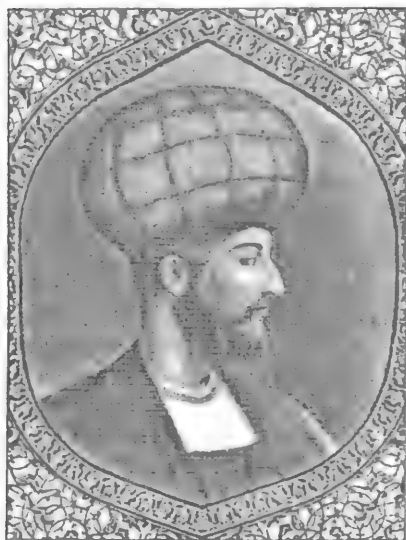
Шах Исмаил I Хатаи (1487 – 1524)

В предлагаемой нами публикации читатель сможет познакомиться с восходящей родословной выдающегося государственного деятеля, поэта, шаха Исмаила I Хатаи по линии его бабушки со стороны матери – Деспине Хатун, урожденной Трапезундской принцессы Теодоры (Катерины) из знаменитого греческого рода Комненов.